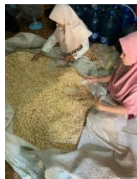
Gambar 7. Pengeringan

Setelah kedelai selesai di rendam selama 1 malam, kemudian kedelainya disebar dan ditata di lantai yang beralas kemudian dikeringkan secara manual menggunakan kipas angin.