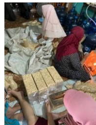
Gambar 9. Pembungkusan

Setelah dirasa tercampur merata antara kedelai dan ragi, maka lakukan pembungkusan menggunakan plastik dan ukurannya sesuai dengan ukuran tempe yang akan dipasarkan nantinya.