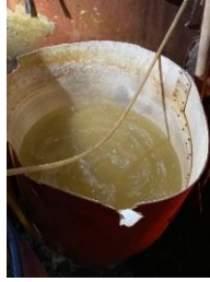
Gambar 3. Perendaman Kedelai