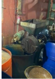
Gambar 4. Penggilingan Kedelai

Setelah dilakukan proses perendaman selama 1 malam, kedelai digiling menggunakan alat khusus penggiling kedelai.