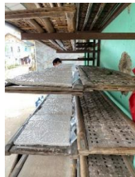
Gambar 10. Penyimpanan

Hasil tempe yang sudah dikemas kemudian disimpan pada ruang penyimpanan sebelum didistribusikan ke pasar.