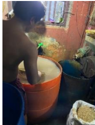
Gambar 5. Penyaringan Kedelai

Proses selanjutnya kedelai disaring secara manual oleh pekerja dengan menggunakan saringan kayu.