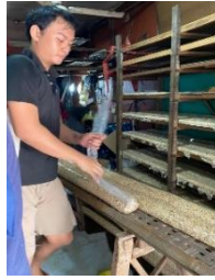
Gambar 8. Pemberian Ragi

Setelah kedelai mongering, campurkan kedelai dengan ragi yang banyaknya disesuaikan dengan banyaknya kedelai yang digunakan pada awal pemrosesan.