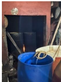
Gambar 6. Perendaman Kedelai Kembali

Lalu setelah kedelai yang sudah digiling dan disaring, hasil kedelainya direndam selama 1 malam kembali.