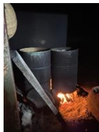
Gambar 2. Perebusan Kedelai

Proses perebusan kedelai pada Pabrik Tempe Bapak Carmin ini dilakukan menggunakan tungku manual yang masih menggunakan kayu bakar untuk perapiannya. Perebusan ini dilakukan selama 1 hari didalam tungku besar yang berisi 10 karung kedelai.