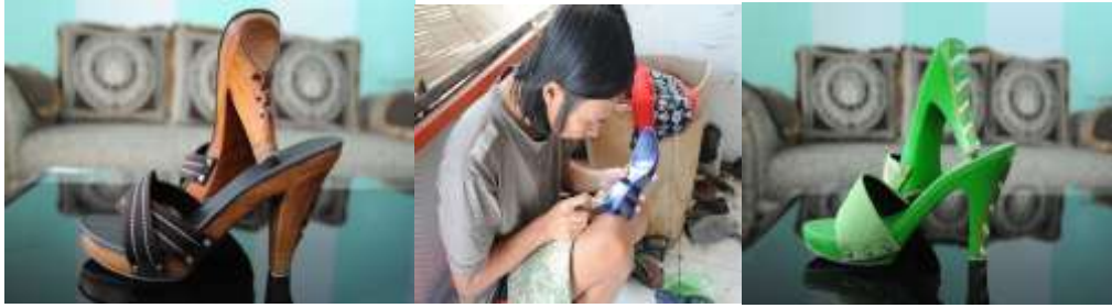
Gambar 4. Proses Pembuatan Kelom Geulis