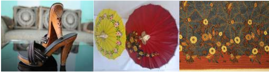
Gambar 6. Produk Kerajinan Kota Tasikmalaya

Untuk pengembangan industri kerajinan kota Tasikmalaya, diperlukan pemetaan terhadap ekosistem kerajinan yang terdiri dari rantai nilai kreatif, market , nurturance environment , marketing dan raw material . Aktor yang harus terlibat dalam ekosistem ini tidak terbatas pada model triple helix yaitu intelektual, pemerintah, dan bisnis, tetapi harus lebih luas dan melibatkan komunitas kreatif dan masyarakat konsumen karya kreatif. Dibutuhkan quad helix model kolaborasi dan jaringan yang mengaitkan intelektual, pemerintah, bisnis dan komunitas. Pada gambar 7 dijelaskan model kewirausahaan sosial berbasis ekonomi kreatif. Tujuan yang ingin dicapai dari model tersebut, komunitas pengrajin akan menjadi sosial entrepreneur dengan memberikan pelatihan dan layanan kepada konsumen serta pendampingan kepada masyarakat.