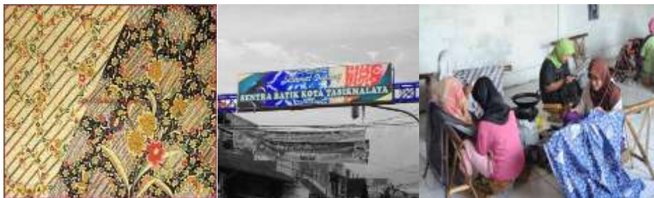
Gambar 5. Proses Pembuatan Batik Tasikmalaya

Sentra batik Tasikmalaya terletak di desa sukapura kecamatan Sukaraja. Secara garis besar batik tasikmalaya memiliki motif batik yang cenderung memberikan kesan semangat kesederhanaan, terbuka, dan pluralis juga memperlihatkan kesan imut dan unyu selaras dengan citra umum wanita sunda. Motif batik Tasikmalaya mempunyai tiga motif batik populer yaitu motif batik burung, motif batik payung, dan motif batik kacang panjang yang sangat kental dengan nuansa kota Parahyangan. Pada gambar 5 memperlihatkan proses pembuatan batik.