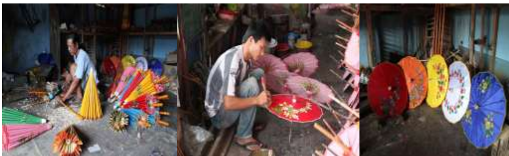
Gambar 3. Proses Pembuatan Payung Geulis

Geulis berarti cantik, elok atau molek. Payung Geulis diartikan sebagai payung cantik yang memiliki estetika sesuai dengan budaya lokal. Ada dua motif payung geulis pertama, motif hias geometris yang berbentuk bangunan, dengan model yang dominan adalah garis lurus, lengkung dan patah-patah. Kedua motif hias non geometris yang didominasi gambar alam seperti tanaman, hewan dan manusia. Payung geulis rangkanya terbuat dari bambu, Setelah dirangkai dan dipasang kain serta kertas, ujung payung dirapikan dengan menggunakan kanji (lem). Agar lebih menarik, rangka bagian dalam diberi benang warna-warni. Harga payung ini di pasaran lokal sangat murah. Untuk satu payung ukuran kecil hanya dihargai Rp. 20.000, sedangkan ukuran sedang sampai ukuran besar berkisar Rp. 30.000 hingga Rp. 50.000. Pada gambar 3 memperlihatkan proses pembuatan payung geulis.