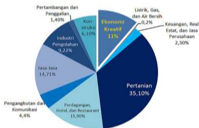
Gambar 1 Persentase Kontribusi Berbagai Sektor Di Indonesia

Kota Tasikmalaya merupakan salah satu sentra industri yang banyak menghasilkan berbagai macam sektor usaha, diantaranya kerajinan tangan, kuliner dan fashion. Sektor ini dapat menjadi pintu masuk industri kreatif dalam bentuk kewirausahaan sosial. Industri kreatif di Indonesia telah memberikan kontribusi untuk membantu perekonomian nasional sebesar 11%, lihat gambar 1 (sumber BPS, Pusdatin Kemenperin, 2016 ).