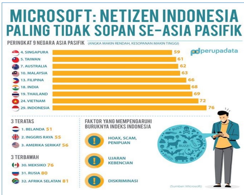
Gambar 1 Hasil survey Microsoft tentang Digital Civility Index (DCI)

Seperti hasil penelitian pada gambar 1 yang dilakukan oleh Microsoft di tahun 2020 tentang Digital Civility Index (DCI), Indonesia menempati urutan ke 29 dari 32 negara di dunia. Hal inilah yang kemudian membawa nama Indonesia menjadi terpuruk di dunia maya. Netizen Indonesia dikenal sangat tidak ramah bahkan sadis di dunia maya. Hal ini tentu berbanding terbalik dengan dunia nyata, dimana Indonesia adalah negara yang dikenal sangat ramah dan santun (Indrawan, 2021).