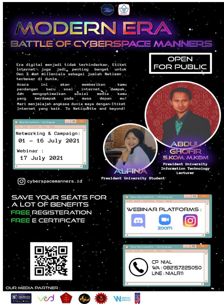
Gambar 3 Poster kegiatan