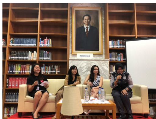
Gambar 3. Seminar SalingJaga di Adam Kurniawan Library, President University