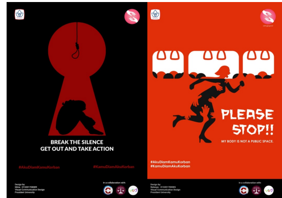
Gambar 6. Contoh Poster SalingJaga

Pada tanggal 6 Desember 2019, seminar dilanjutkan ke kota Kuningan bertempat di SMK Pertiwi Kuningan (Gambar 7). Seminar ini didukung oleh Bupati Kuningan, Bapak H. Acep Purnama, S.H., M.H. Bapak H. Acep Purnama mengatakan "Seringnya terjadi pelecehan di ruang publik dikarenakan mental masyarakat masih rendah sehingga mudah untuk diadu domba dan banyak masyarakat juga masih kurang melek terhadap teknologi sehingga, teknologi masih sering disalahgunakan untuk menonton dan menyebarkan konten pornografi" (Gambar 8).