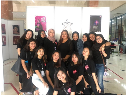
Gambar 5. Pelaksanaan Pameran SalingJaga