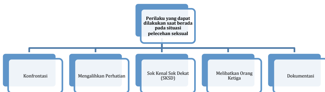
Gambar 4. Hal-hal yang Dapat Dilakukan Saat Berada dalam Situasi Pelecehan Seksual

Bersamaan dengan seminar, diadakan juga sebuah pameran yang dilangsungkan hingga keesokan harinya tanggal 4 Desember 2019 (Gambar 5). Pameran ini memamerkan karya mahasiswi Desain Komunikasi Visual President University dalam bentuk poster (Gambar 6). Poster-poster ini menampilkan karya dengan tema anti pelecehan seksual di ruang publik. Ditampilkan juga beberapa bukti fisik korban pelecehan seksual berupa baju yang mereka gunakan saat mengalami kejadian. Kampanye SalingJaga mampu menarik perhatian para mahasiswa President University.