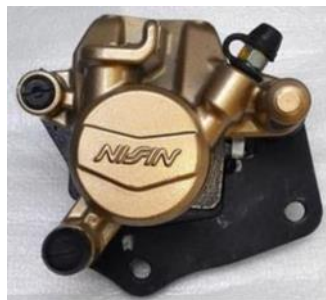
Gambar 6. Kaliper Rem

Kaliper rem terdapat piston atau penekan yang berfungsi untuk menekan kampas rem. Jumlah piston atau penekan dalam kaliper rem beragam, ada yang hanya satu piston dan ada juga yang terdiri atas dua atau tiga piston dalam kaliper rem, bisa dilihat pada gambar 6.