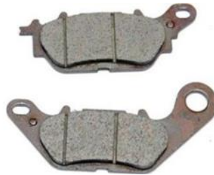
Gambar 7. Kampas Rem

rem terdapat garis-garis yang berfungsi untuk mengurangi panas akibat gesekan [3], bisa dilihat pada gambar 7.