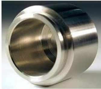
Gambar 4. Piston

Piston pada rem cakram berfungsi sebagai pembuka dan penutup lubang aliran minyak rem pada bak penampungan untuk menekan minyak rem ke arah kaliper, bisa dilihat pada gambar 4.