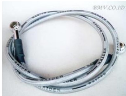
Gambar 5. Selang Rem

Selang rem berfungsi sebagai alat penyalur dari minyak rem yang telah ditekan oleh piston ke kaliper rem, bisa dilihat pada gambar 5.