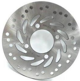
Gambar 2. Piringan Cakram

Komponen ini terbuat dari besi tuang yang dapat menahan panas dari gesekan akibat proses pengereman dan tahan terhadap korosi. Piringan cakram merupakan komponen yang secara langsung menghasilkan proses pengereman dengan terjadinya gesekan antara piringan cakram tersebut dengan kampas rem, bisa dilihat pada gambar 2.