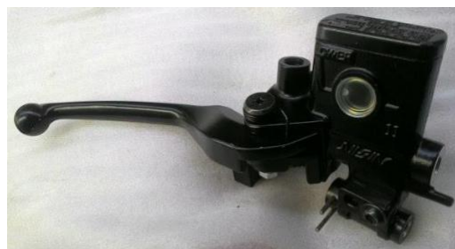
Gambar 3. Master Rem

Master rem merupakan komponen yang paling penting dari rem cakram yaitu berfungsi sebagai penekan minyak rem. Hal tersebut dikarenakan sistem kerja dari rem cakram adalah tekanan dari minyak rem terhadap kaliper rem, bisa dilihat pada gambar 3.