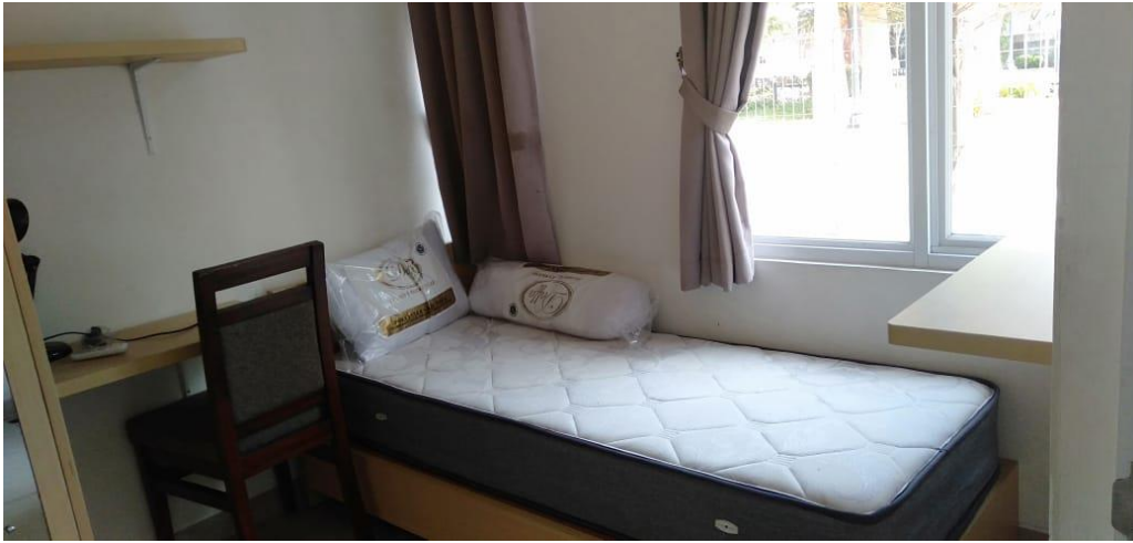
Gambar 2. Kamar Isolasi

Terdapat salah satu unit rumah yang difungsikan sebagai kantor pengelola dan penyimpanan peralatan-peralatan tambahan seperti: