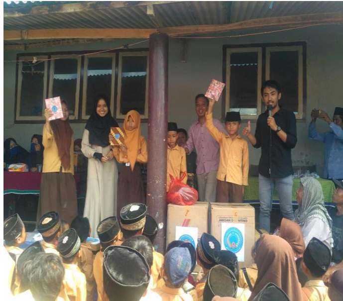
Gambar 2. Kelas Motivasi untuk Siswa Sekolah Dasar

Tidak hanya peserta didik, sambutan masyarakatpun sangat luar biasa. Perangkat desa mendukung kegiatan ini. Banyak doorprize yang disiapkan di acara pembukaaan agar acara semakin semarak dan meriah (lihat Gambar 3).