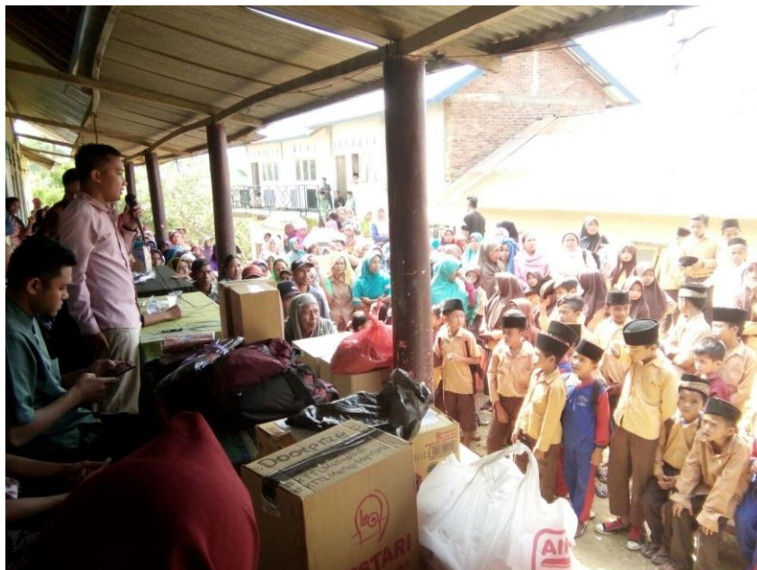
Gambar 3. Antusiasme Masyarakat

Tidak hanya peserta didik, sambutan masyarakatpun sangat luar biasa. Perangkat desa mendukung kegiatan ini. Banyak doorprize yang disiapkan di acara pembukaaan agar acara semakin semarak dan meriah (lihat Gambar 3).