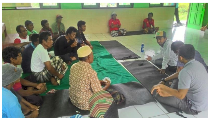
Gambar 4. Sosialisasi Pentingnya Asuransi Gempa Bumi

pemuda dan juga masyarakat desa yang ada terkena dampak gempa baik secara materi dan non-materi. Pada sesi ini dijelaskan bagaimana pentingnya untuk mengasuransikan diri, dengan membeli asuransi gempa bumi. Pada kesempatan ini, dijelaskan pentingnya asuransi gempa bumi, dan apa dampak positif yang bisa diberikan oleh pihak asuransi kepada para korban-korban yang mengalami bencana alam seperti gempa bumi. Animo masyarakat dalam mengikuti kegiatan sosialisasi gempa bumi sangatlah tinggi (lihat Gambar 4). Hal ini dapat dilihat dari banyaknya partisipasi dari masyarakat untuk ikut dalam pertemuan yang telah direncanakan sebelumnya. Dalam kegiatan ini, diketahui bahwa masyarakat ini tidak tahu tentang adanya asuransi gempa bumi. Setelah mendapatkan pengetahuan tersebut, tidak banyak masyarakat yang mau mencoba untuk mendaftarkan diri mereka dalam mengikuti asuransi bencana gempa bumi. Akan tetapi, sebagian besar belum mampu mengikutinya karena keterbatasan ekonomi saat ini.